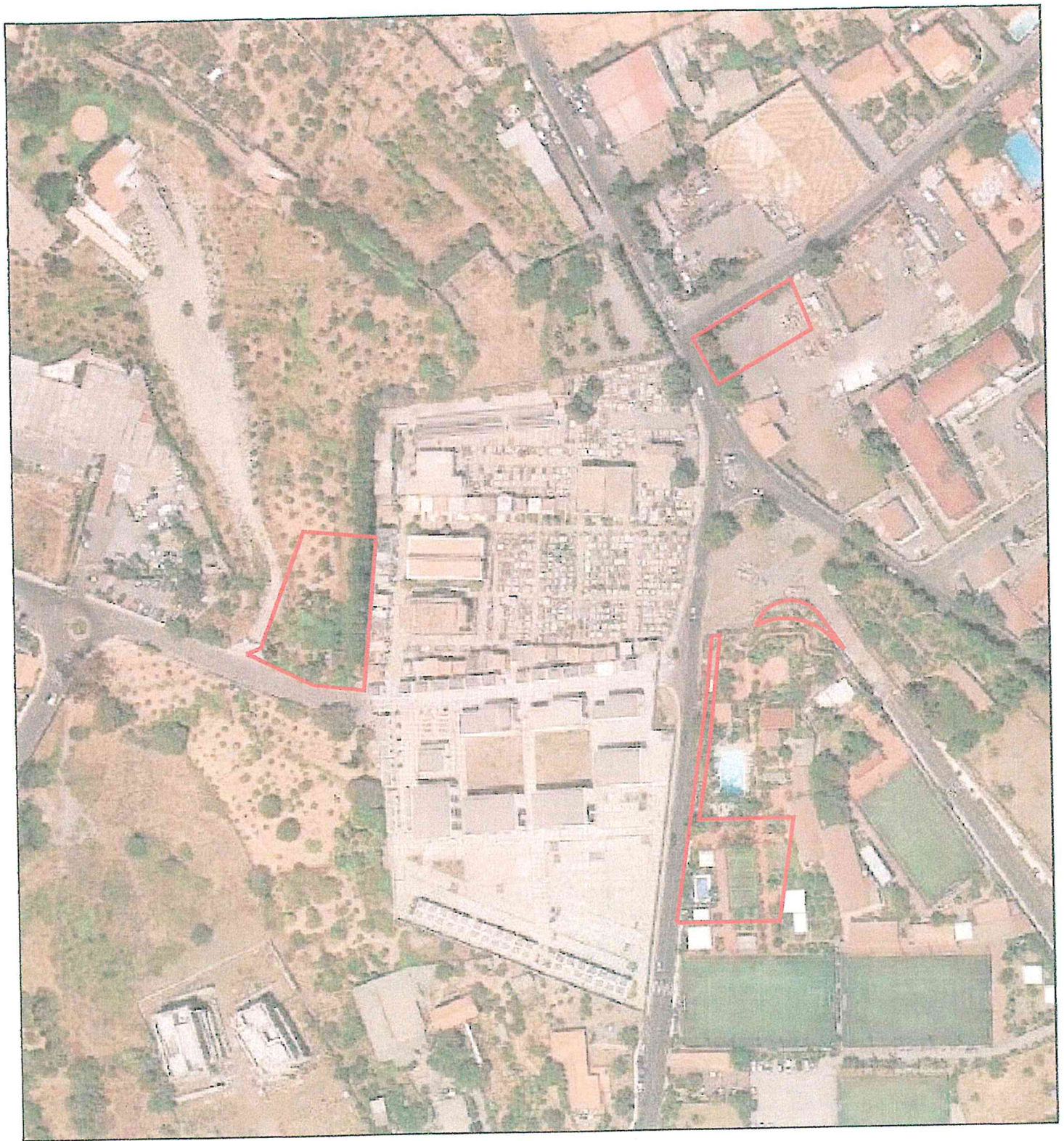
ORTOFOTO (da Google Earth)